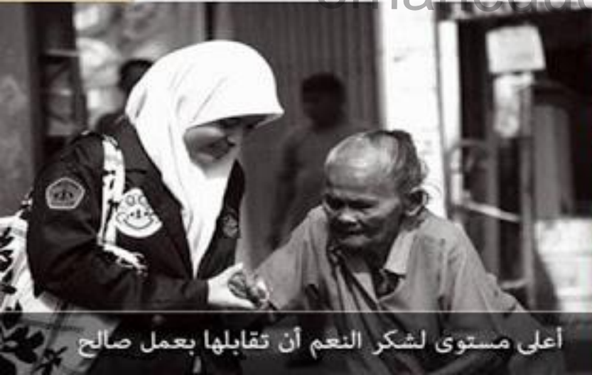
أعلى مستوى لشكر النعم أن تقابلها بعمل صالح